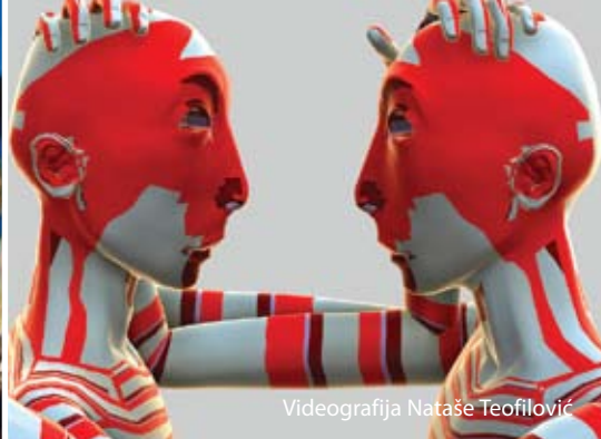
Videografija Nataše Teofilović