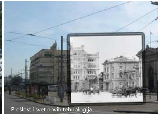
Prošlost i svet novih tehnologija