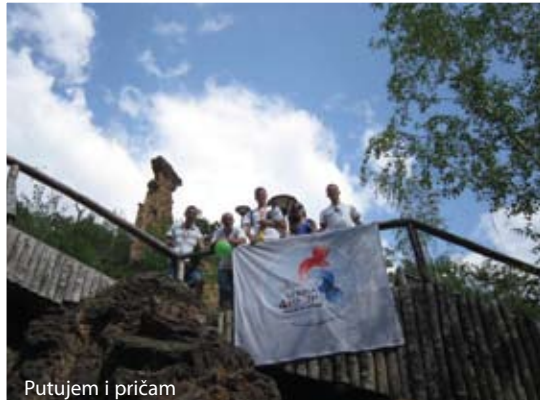
Putujem i pričam