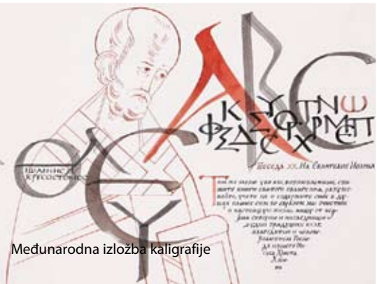
Međunarodna izložba kaligrafije