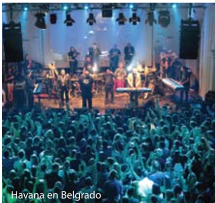
Havana en Belgrado