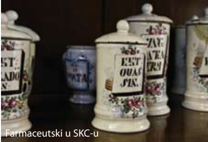
Farmaceutski u SKC-u