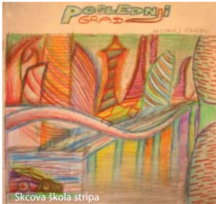
Skcova škola stripa