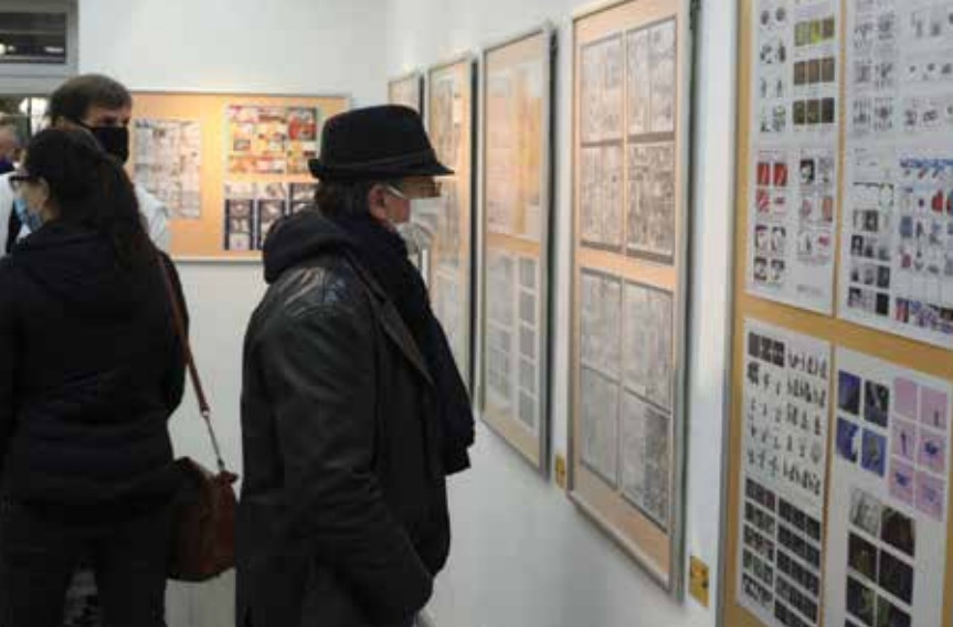
Storyboard - графички визуелизована „прича“ будуће екранизације одређеног сценарија, изложба, Срећна галерија, 29. октобар