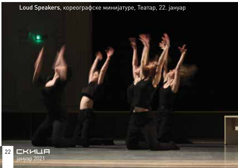
Loud Speakers, кореографске минијатуре , Театар, 22. јануар