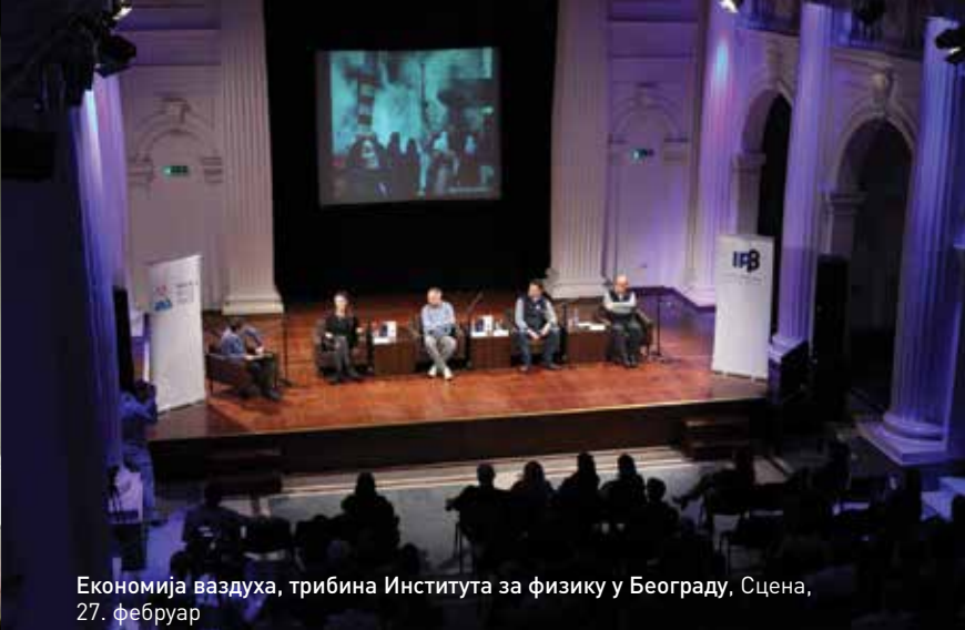
Економија ваздуха, трибина Института за физику у Београду, Сцена, 27. фебруар