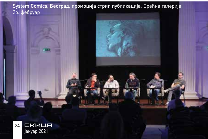
System Comics, Београд, промоција стрип публикација, Срећна галерија, 26. фебруар