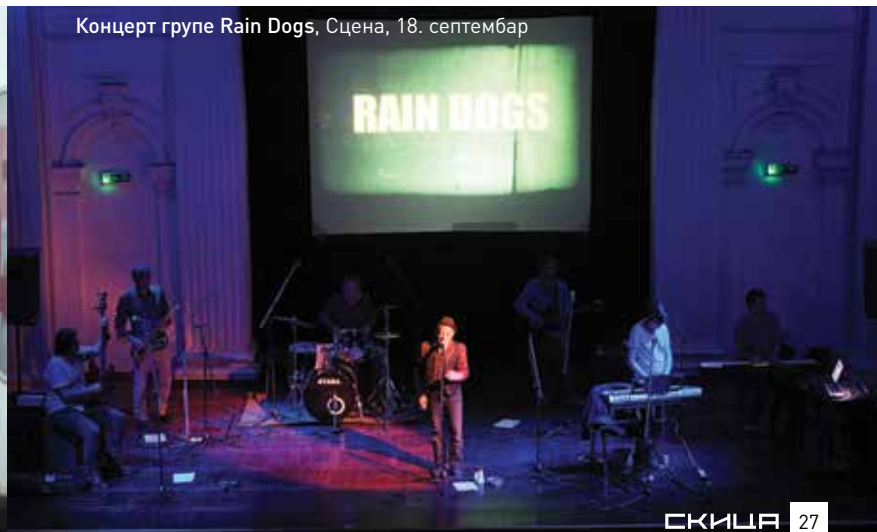
Концерт групе Rain Dogs, Сцена, 18. септембар