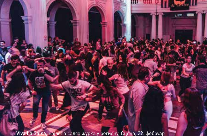
Viva La Salsa, највећа салса журка у региону, Сцена, 29. фебруар

МАРТ - месец језика, са Лазаром или Лазарем на Тенерифима или Тенерифама, Форум, 4. март