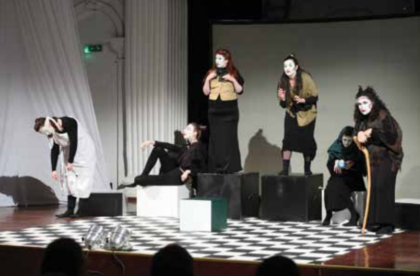
Хамелн, гостовање Академског позоришта Студентског културног центра Крагујевац, Театар СКЦ, 20. фебруар