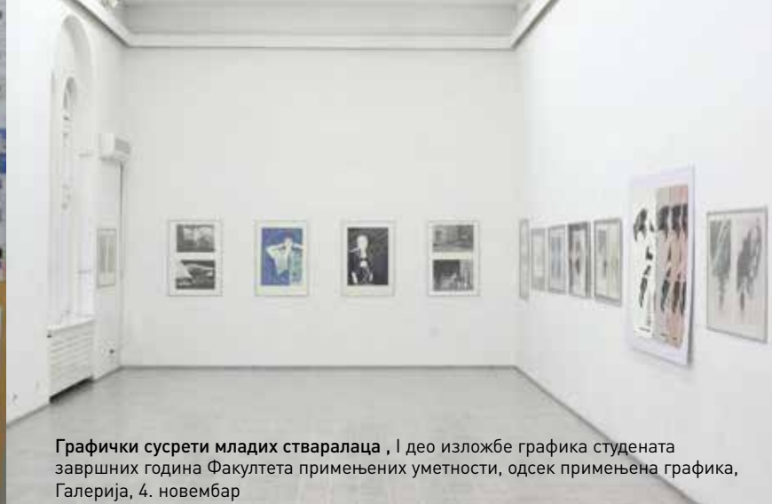
Графички сусрети младих стваралаца , I део изложбе графика студената завршних година Факултета примењених уметности, одсек примењена графика, Галерија, 4. новембар