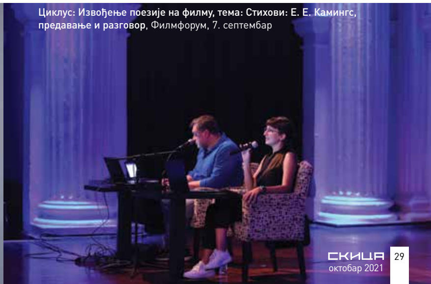
Циклус: Извођење поезије на филму, тема: Стихови: Е. Е. Камингс, предавање и разговор, Филмфорум, 7. септембар