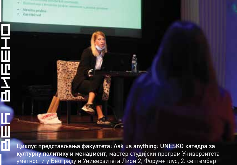
Циклус представљања факултета: Ask us anything: UNESKO катедра за културну политику и менаџмент, мастер студијски програм Универзитета уметности у Београду и Универзитета Лион 2, Форум+плус, 2. септембар