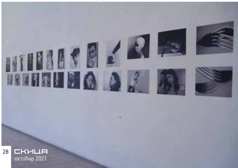
Од конкретног ка апстрактном, изложба фотографија студената Факултета савремених уметности, Галерија, 3. септембар