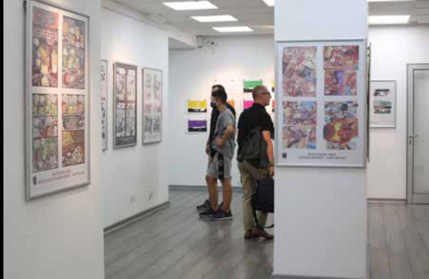
Grand prix салона 2003-2019, међународна изложба победничких радова са досадашњих конкурса Салона стрипа, Срећна галерија, 16. септембар