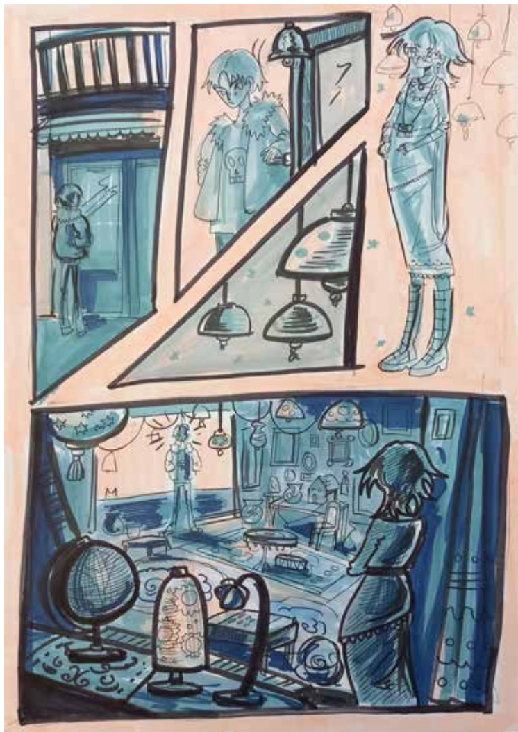
VIII годишња izložba najboljih radova SKC-ove besplatne Škole stripa i ilustracije za polaznike uzrasta do 15 godina, Srećna galerija, 5 - 21. decembar