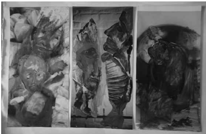
Смедеревска Паланка, Србија; Галерија „Сингидунум“, Београд, Србија; 2016. ДКЦ Мајдан, Београд; 2016. ЦЗК Стара Пазова, Стара Пазова; 2016. Кућа Краља Петра 1, Београд;