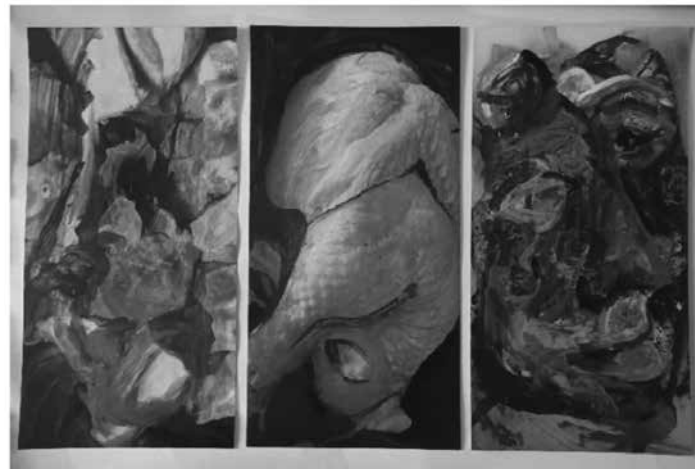
Пројекат „Рок трајања – неограничен“ садржи два видео рада, интервенције на фотографијама груписане у формате 90 x 60 cm и два печата.

Видео радови „Предатор“ и „Служимо се зубима и уснама“ у форми диптиха јесу сносици приказ доживљаја стварности, психе, емоција и осталих утицаја друштва.